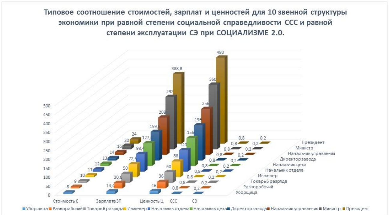
Рис. 2. Типовое соотношение стоимостей, зарплат и ценностей для 10-тизвенной структуры экономики при равной для всех степени социальной справедливости ССС и степени эксплуатации СЭ при социализме 2.0.

Здесь стоимости продуктов труда категорий работников условно изменяются от 8 ед. у уборщицы до 24 ед. у президента страны. Соответственно, ценности – от 16 ед. у уборщицы до 480 ед. у президента. При этом, при сохранении для всех категорий работников равной степени социальной справедливости ССС=0,8 и степени эксплуатации СЭ=0,2 заработная плата (вознаграждение за труд) изменяется от 14,4 ед. у уборщицы до 388,8 ед. у президента страны.